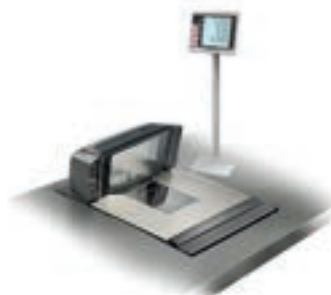
Sistema di pesatura checkout integrato nel punto cassa esistente con display