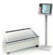
Sistema di pesatura checkout con base chiusa, contenente la cella di carico e il display.